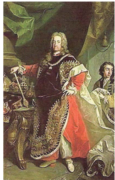
Carlo VI d'Asburgo